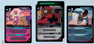
Equipe de Campo (mesa)