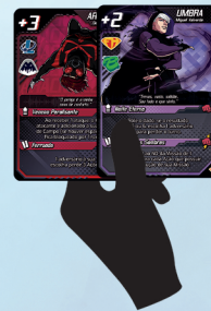
Equipe de Apoio (mão)

O primeiro jogador é definido por quem possuir o Líder com o menor valor de Bônus. Em caso de empate é decidido no dado. A ordem dos demais jogadores segue em sentido horário a partir do primeiro.